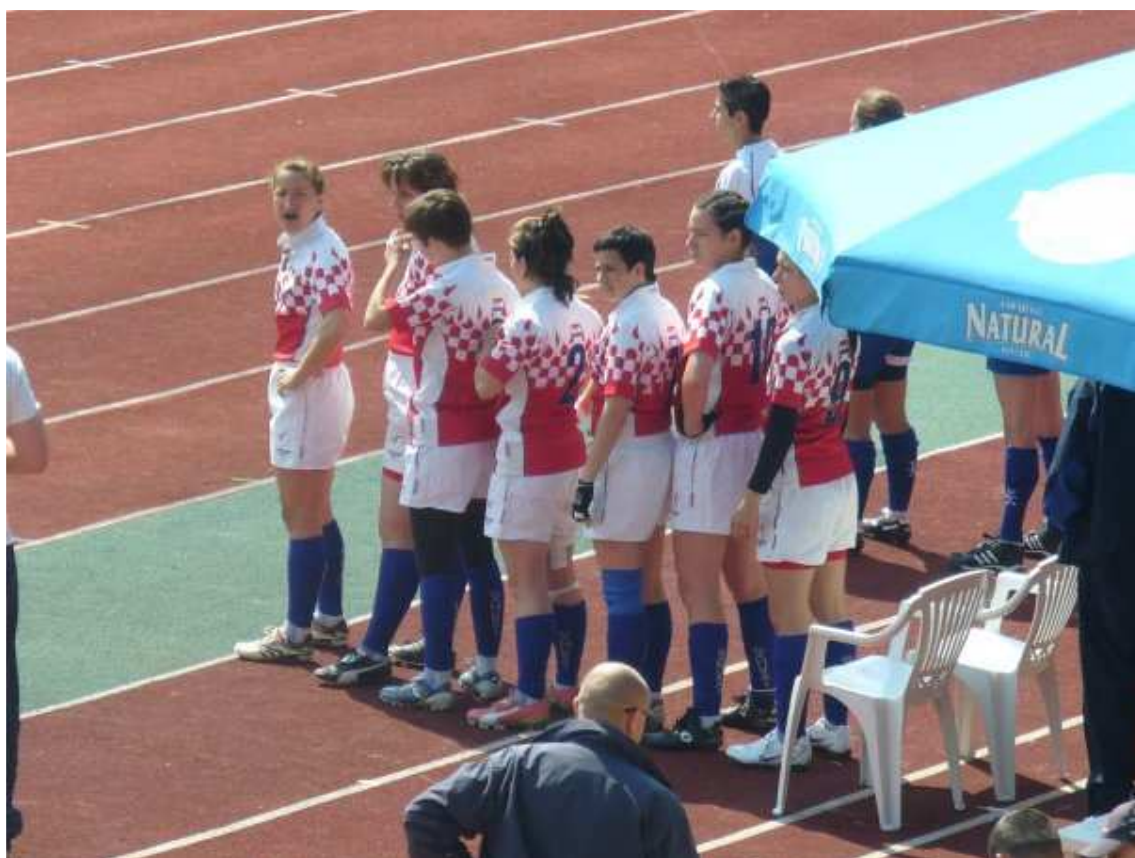
pred početak utakmice s Izraelom