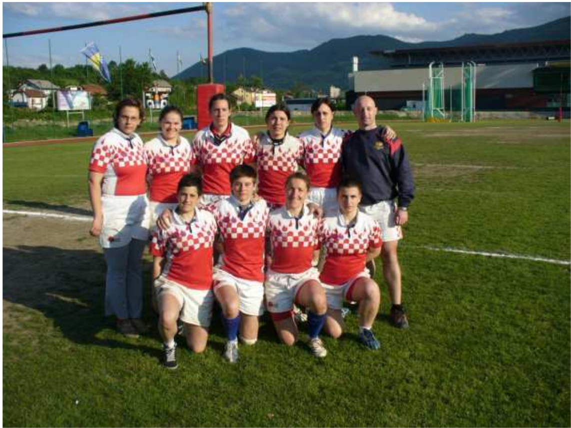
EP Zenica, 11.5.2008.